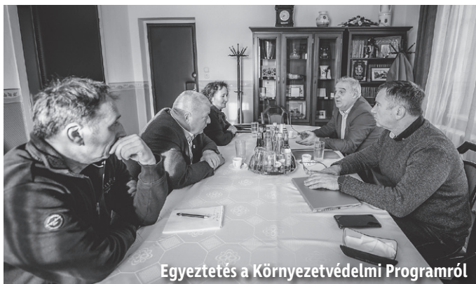
Egyeztetés a Környezetvédelmi Programról

A szebb és tisztább lakókörnyezet kialakítása és megóvása a célja Mezőkövesd új Környezetvédelmi Programjának, melyet városunk önkormányzata hoz létre.