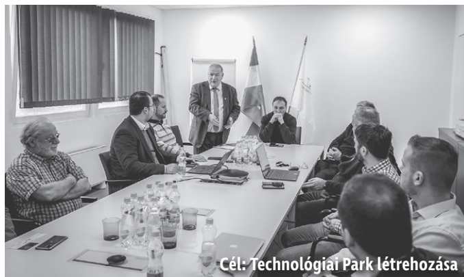
Cél: Technológiai Park létrehozása