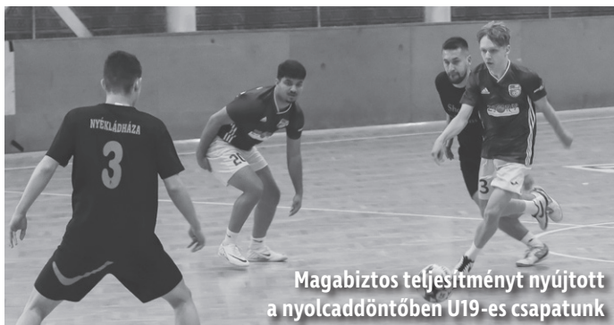
Magabiztos teljesítményt nyújtott a nyolcaddöntőben U19-es csapatunk