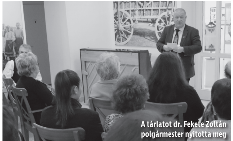
A tárlatot dr. Fekete Zoltán polgármester nyitotta meg