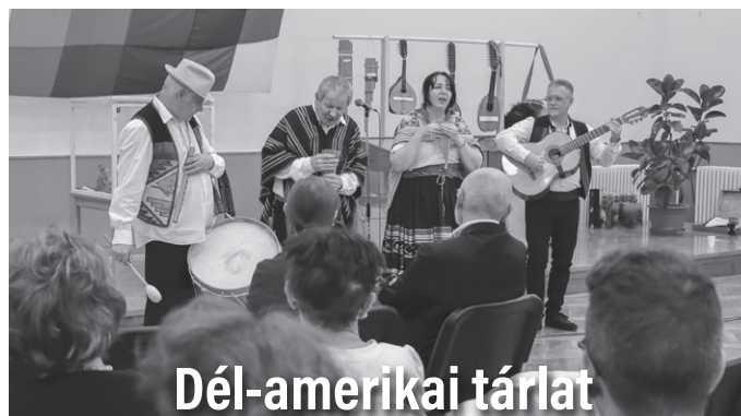
Dél-amerikai tárlat A „Nap kapujában” – Ecuador – Peru – Bolívia címmel nyílt kiállítás a Közösségi Házban.

A Mezőkövesdi Alapfokú Művészeti Iskolában megtartott eseményen többek között Mozart, Purcell, Muszorgszkij és Lully művei csendültek fel február 20-án. Ezen felül például Karai József: Groesztk tánc, Alan Street: Rondino című darabja mellett Michael Jackson egyik ismert slágere is elhangzott, továbbá Gyufkó Róbert saját darabján kívül Reszegi Gergő: Rondó ütőkre című műsorát is bemutatták a koncerten. B. K.