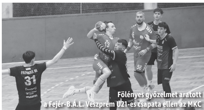
Fülényes győzelmet aratott a Fejér-B.Á.L. Veszprém U21-es csapata ellen az MKC

Az MKC 19 fordulót követően 24 ponttal a 6. helyen áll a tabellán. bokri