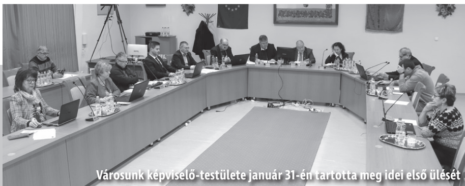
Városunk képviselő-testülete január 31-én tartotta meg idei első ülését

A 2024. évi költségvetés első olvasatáról, az 1848-49-es forradalom és szabadságharc városi megemlékezéséről, a város esélyegyenlőségi programjáról is tárgyalt városunk képviselő-testülete az idei első ülésén.