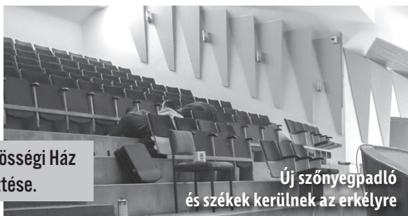
Elkezdődött a Közösségi Ház újabb fejlesztése.